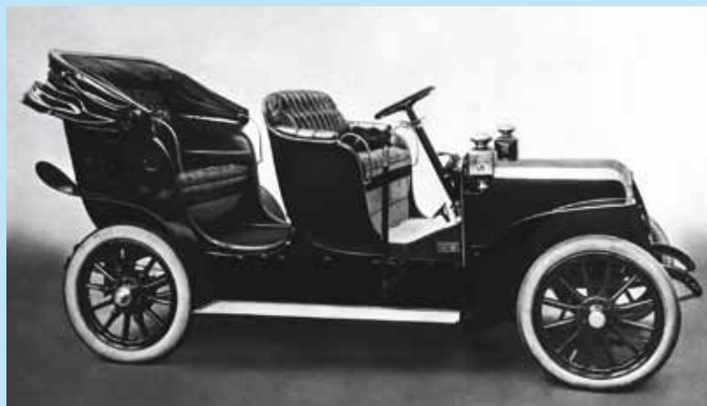
E-Mobilität anno 1905: Die „Elektrische Viktoria“ der Firma Siemens